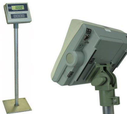
Stojak do panelu sterującego