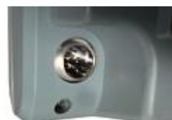
Wyjście przekaźnika High-OK-Low do sterowania urządzeń (np. dozownika)