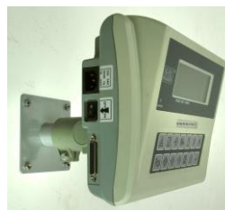
Uchwyt ścienny do panelu sterującego